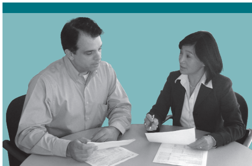
TR-24-CHI (8/15) (背面)